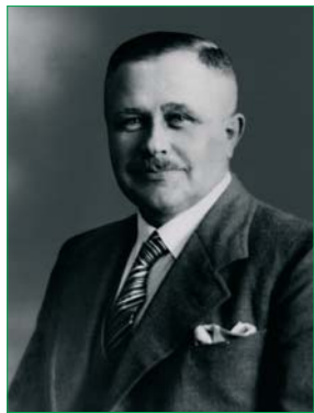
Август Клаас, засновник фірми

Першою масовою машиною фірми CLAAS став комбайн «Super». Уперше його випробували влітку 1943 року. Від 1946 року було розпочато вже серійне виробництво зернозбирального комбайна, пристосованого до європейських умов. До 1978 року таких комбайнів, разом із модифікаціями, фірма «CLAAS» випустила 65000. А у 1955 році CLAAS випустив перший самохідний зернозбиральний комбайн під маркою SF 55 (від Selbstfahrer – «самохід», нім.) З того часу комбайн нерозривно асоціюється з ім'ям CLAAS. Компанія стрімко й успішно розвивається, її стратегія завжди спрямована на інновації, на щонайвищі стандарти якості, надійності, продуктивності.