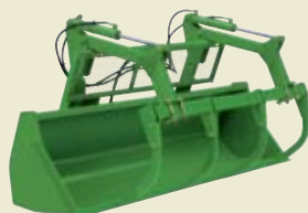
4-ПАЛЬЦЕВЫЙ ЗАХВАТ ДЛЯ ТЮКОВ И СИЛОСА