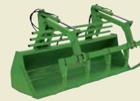
5-ПАЛЬЦЕВЫЙ ЗАХВАТ ДЛЯ ТЮКОВ И СИЛОСА