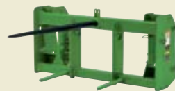
ШТЫРЬ ДЛЯ ТЮКОВ