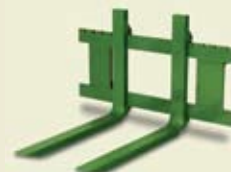
ВИЛОЧНЫЙ ЗАХВАТ ДЛЯ ПОДДОНОВ